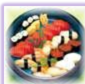
寿 司 4 台