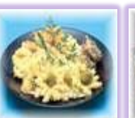
天ぷら 2 台