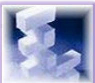
ドライアイス追加