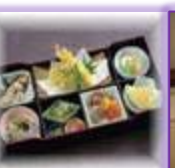
会席膳 10 個