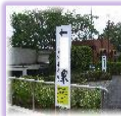
道案内看板 3 枚