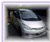
寝台車 1 0 K