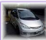
寝台車 2 回目