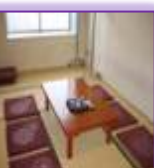
控室 3 時間