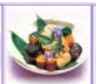
煮 物 2 台