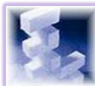
ドライアイス 1 回