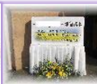
式場看板 1 枚