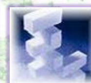
ドライアイス追加 6.300